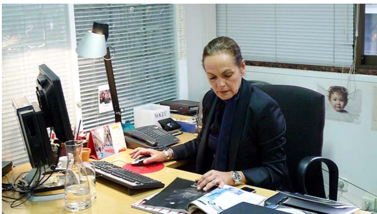
Редакция Vogue Португалия